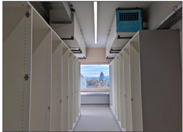
Materialraum mit Lüftung