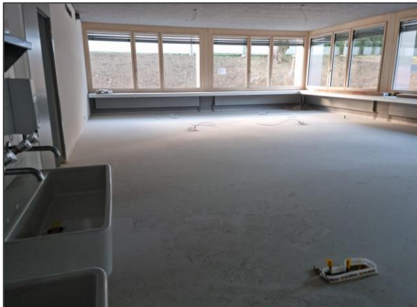
grosszügiger NT-Raum im EG