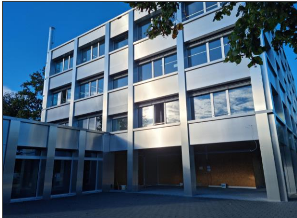
Schulhaus Dörfli 5

Die Sanierungsarbeiten des Schulhauses Dörfli 5 laufen nach Plan. Nach den Weihnachtsferien kann mit dem Unterricht im renovierten Schulhaus gestartet werden. Nach den Sportferien 2022 werden dann auch die Spezialfächer NT und TTG im Dörfli 5 unterrichtet.