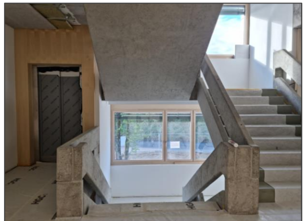
Treppenhaus mit Lift