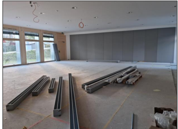
Aula mit neuem Notausgang